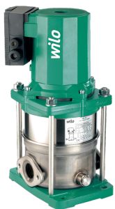
Як на рисунку